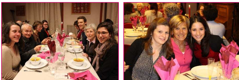
Ci-dessous, le dîner de Bruxelles, organisé lors de la Chandeleur et qui a rassemblé plus de cent personnes !