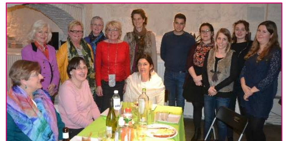
Ci-dessous, à Namur.