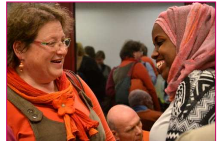
Ci-dessus, à Louvain-la-Neuve. L'antenne y organisait son premier dîner intergénérationnel.